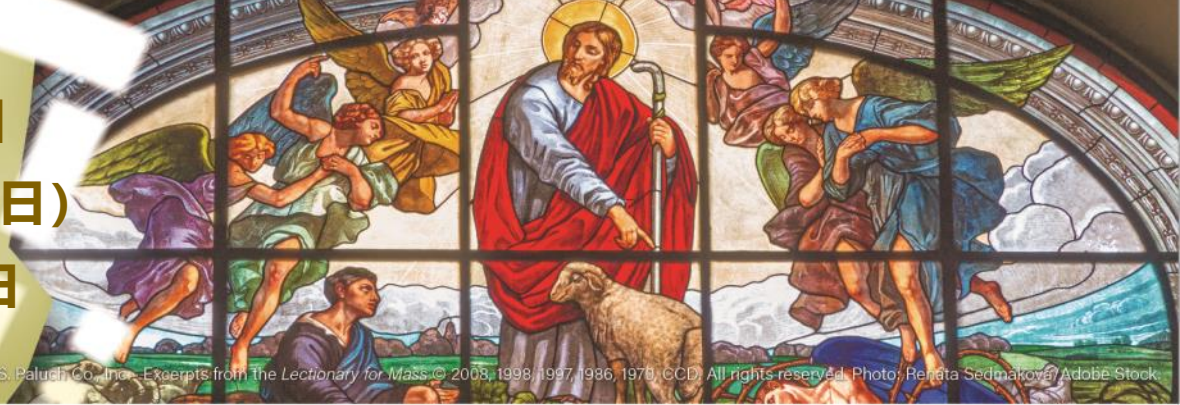
© J. S. Paluch Co., Inc. Excerpts from The Lectionary for Mass © 2008, 1998, 1997, 1986, 1970, CCD. All rights reserved.